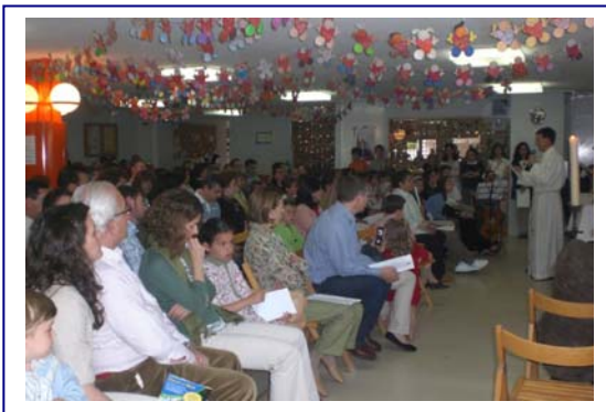
Jornada de Puertas Abiertas: Eucaristía

Además de significar una jornada de convivencia de padres, hijos, profesores y las Hermanas de Cristo Rey, lejos del ambiente académico y del día a día, es una Jornada solidaria . Por el aperitivo que compartimos se cobra una cantidad simbólica, y todos los fondos recaudados se destinan a una obra social. En esta ocasión, gracias a la participación de todos se pudieron dar 20 becas de estudios a niños y jóvenes sin recursos de la localidad senegalesa de Mbour.