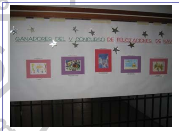
Tarjetas navideñas ganadoras en 2008

Para el presente curso escolar, y por decisión unánime de la Asamblea del APA celebrada en noviembre 2007, la agenda la adquirirán las familias, y los recursos se emplearían en atender prioridades más urgentes del colegio, sobre todo relacionadas con la ampliación al ciclo de enseñanza secundaria