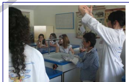
Jornada de Puertas Abiertas: Talleres "Ciencia Divertida"

Además, durante la jornada se organizan dos talleres de "Ciencia Divertida" orientados a distintas edades que se repiten a lo largo de la mañana, para que pueda participar un mayor número de alumnos.