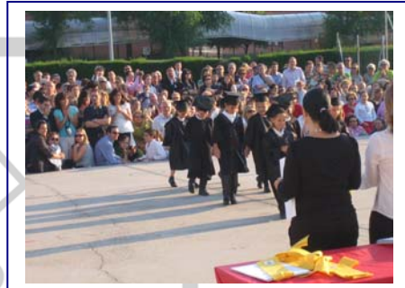
Ceremonia de Graduación de Infantil

Cada año, el APA Cristo Rey contribuye a la ceremonia de graduación de los alumnos que concluyen un ciclo, obsequiándoles con las orlas y una fotografía de su clase, como recuerdo.